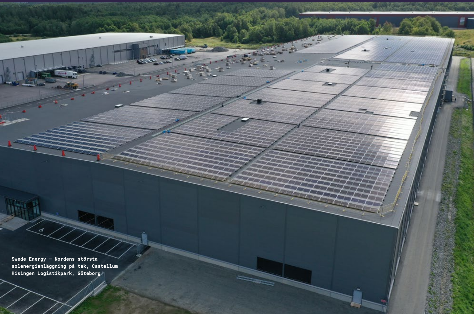
Swede Energy - Nordens största solenergianläggning på tak, Castellum Hisingen Logistikpark, Göteborg