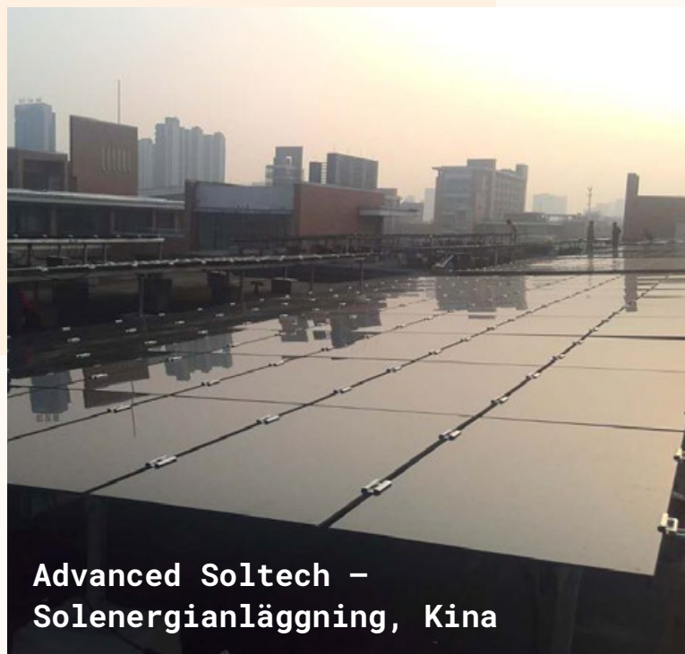
Advanced Soltech – Solenergianläggning, Kina